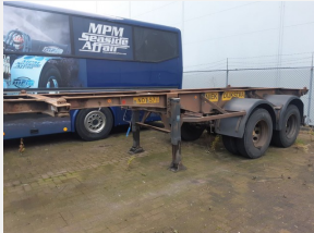
Van Hool 2 Axles ROR steel suspension 20ft